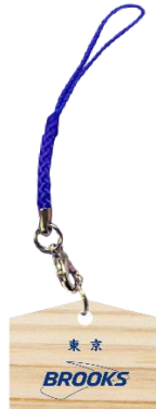
「オリジナルミニ絵馬」

願いや目標をブルックスオリジナル絵馬に記入し、店内の絵馬掛けに結んでいただけます。