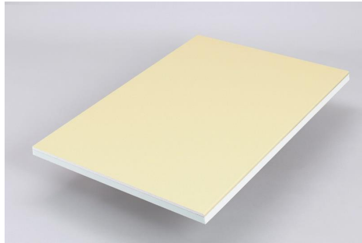
写真:『アキレス準不燃 QD パネル』

当社は硬質ウレタンフォーム断熱材のリーディングカンパニーとして、新工法・新製品の普及を進めるとともに今後も開発に取り組み、「2050年カーボンニュートラル」の達成など持続可能な社会の実現に貢献していきます。